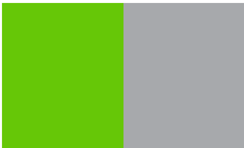
Format B: 1/2 Seite hoch: 148,5 x 105 mm 500,00 EUR