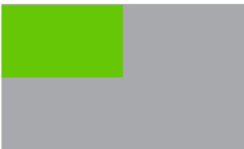
Format C: 1/4 Seite quer: 74,25 x 105 mm 270,00 EUR